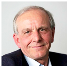
A. KAHN , Médecin, généticien et essayiste